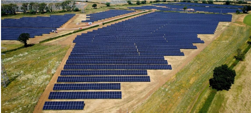
Ferme solaire Adstock – Royaume-Uni