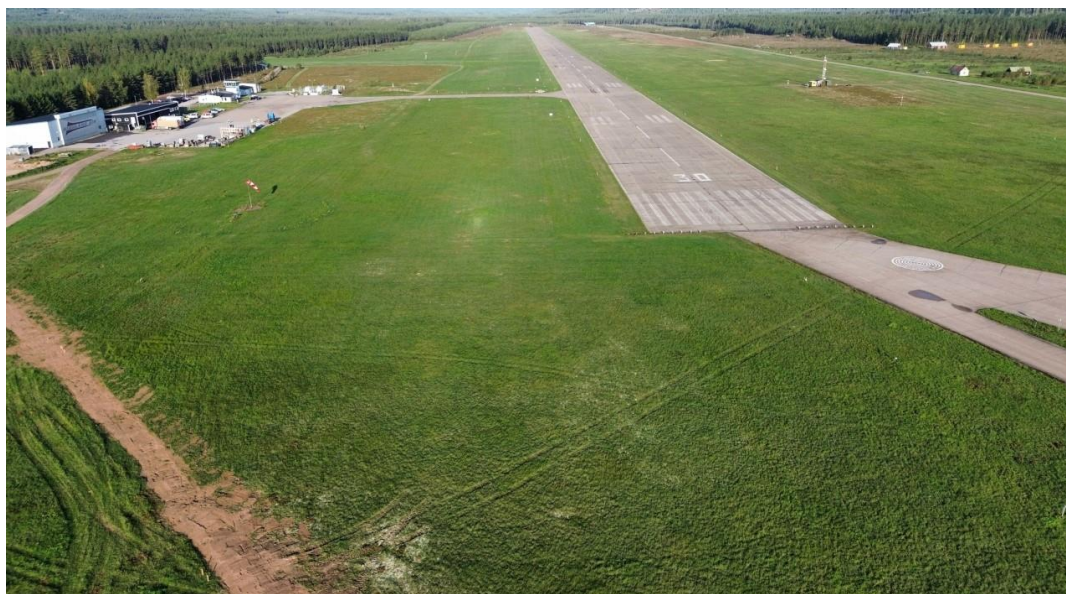
Gestion du projet par Solkompaniet et Bouygues Energies & Services à l'aéroport de Hultsfred